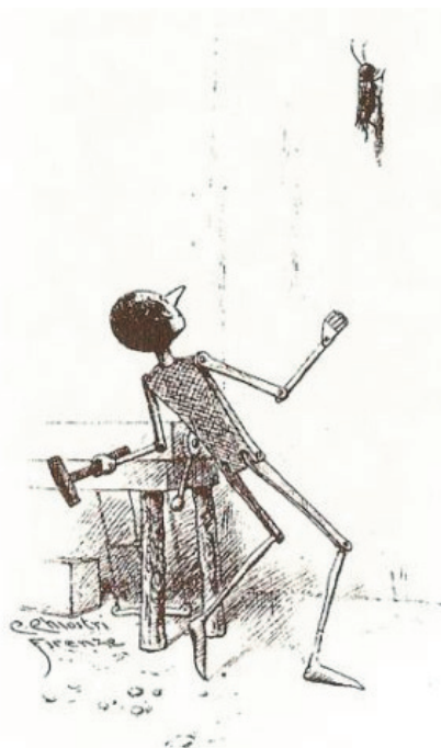
Ilustración de Carlo Chiostrri (1901)

Al oír estas últimas palabras, Pinocho, enfurecido, se puso de pie de un salto y tomando del banco un martillo de madera lo arrojó contra el Grillo parlante.