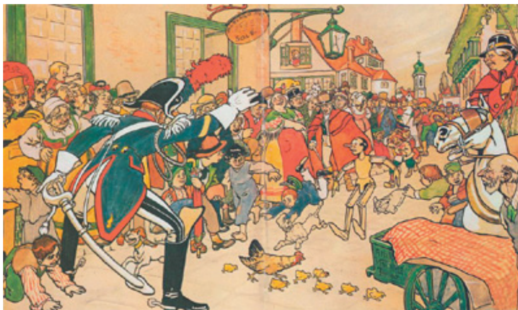
Ilustración de Attilio Mussino (1911)

Al final, por suerte, apareció un guardia, el cual, oyendo todo aquel alboroto y creyendo que se trataba de un potrillo que se le había encabritado a su dueño, se plantó resueltamente con las piernas abiertas en medio de la calle, con la decidida intención de detenerlo e impedir que ocurrieran desgracias mayores.