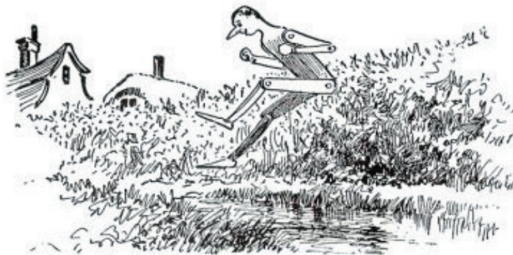
Ilustración de Charles Copeland (1904)

Les diré, muchachos, que mientras el pobre Geppetto era conducido sin culpa a la prisión, aquel bribón de Pinocho, que había quedado libre de las garras del guardia, corría a través de los campos para llegar antes a casa; y en su furiosa carrera saltaba riscos altísimos, setos espinosos y fosos llenos de agua, tal como hubiera podido hacerlo una cabra o una liebre perseguida por unos cazadores.