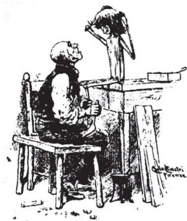
Ilustración de Carlo Chiostrì (1901)

Y Pinocho, en vez de devolverle la peluca, se la puso en su propia cabeza, quedándose medio ahogado debajo.