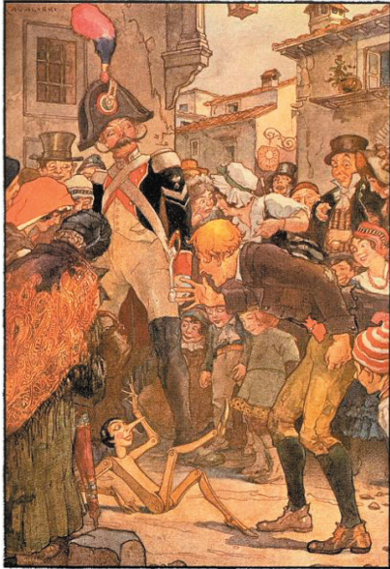
Ilustración de Luigi E. Maria Augusta Cavalieri (1924)

—¡Ese Geppetto parece una buena persona! ¡Pero con los niños es un verdadero tirano! ¡Si le dejan ese pobre muñeco entre las manos, es capaz de hacerlo pedazos!... (4)