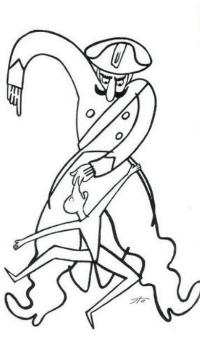
Ilustración de Sergio Tofano (1921)

se las ingenió para pasarle por sorpresa entre las piernas; sin embargo la treta le falló.